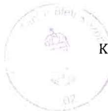
Katonáné Barna Zsuzsanna tankerületi igazgató

Kapják: 1.) Címzett 2.) Ceglédi Tankerületi Központ irattár